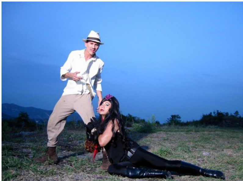
Adventures of Iron Pussy , reż. Apichatpong Weerasethakul i Michael Shaowanasai