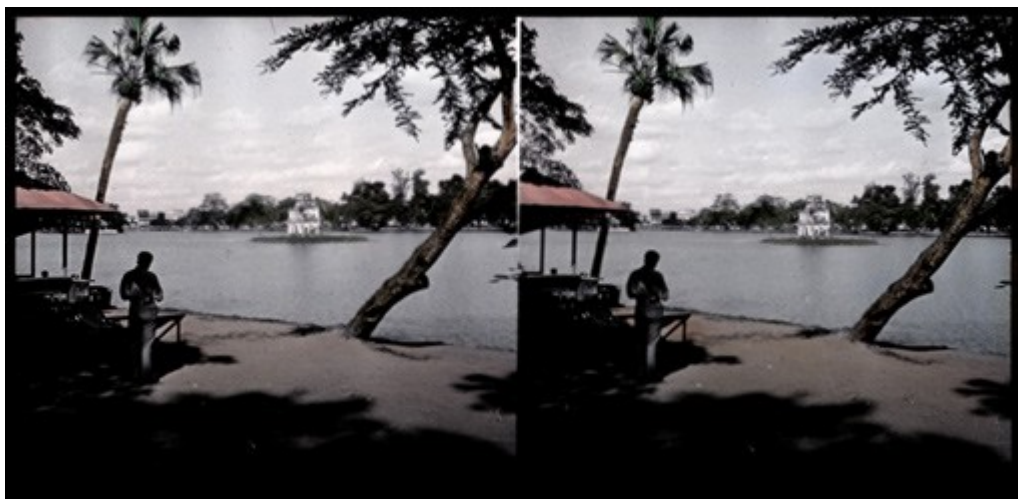
stereoskopowe przezrocze z wystawy Wyprawa do Wietnamu

Więcej informacji o wystawie: www.fotoplastikonwarszawski.pl