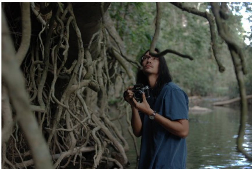
Nimfa , reż. Pen-Ek Ratanaruang

Pen-ek Ratanaruang urodził się w 1962 roku w Bangkoku. Jest filmowym samoukiem uważanym obecnie za jednego z czołowych, obok Wisita Sasanatienga i Apichatponga Weerasethakula, przedstawiciela "Nowej Fali" kina tajskiego. W 2003 roku zrealizował wielokrotnie nagradzany „ Last life in the universe ” ze słynnym japońskim aktorem Asano Tadanobu, po którym zyskał międzynarodową sławę. W przeglądzie filmów reżysera zaprezentujemy także jego najnowszy film pt „ Nimfa ” ( Nang mai ) - zachwycający zmysłowością i wyrafinowaną formą obraz rozgrywający się w tajskiej dżungli. Nie zabraknie także jego „ A Transistor Love Story ” („Monrak Transistor”, 2000), remake hitu tajlandzkiego kina muzycznego z lat 70., w którym reaktywował modę na charakterystyczną dla regionu muzykę country - luk thung .