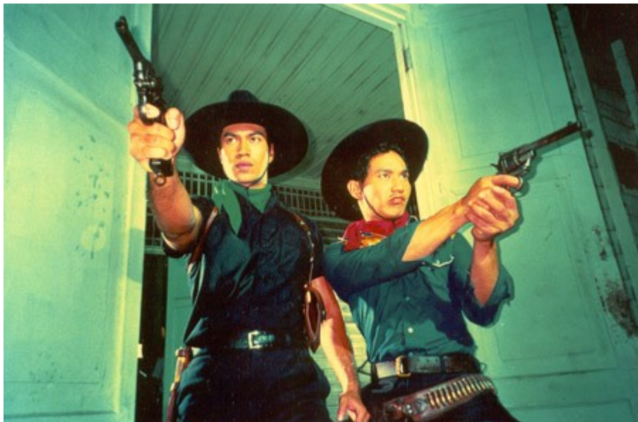
Łzy Czarnego Tygrysa, reż. Wisit Sasanatieng

Pełen program festiwalu zostanie opublikowany 1 października 2009 na stronie festiwalu: www.piecsmakow.pl